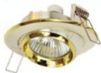
ТОЧЕЧНЫЙ СВЕТИЛЬНИК HDL-DE 02 SCHR/G. Интернет-магазин Brille. 37 грн

КУХНЯ. Слева при входе в кухню расположена широкая рабочая поверхность с мойкой и плитой, а справа в нише – полки для хранения утвари и холодильник. Стена у двери выложена зеркальной плиткой, она визуально «удваивает пространство», как будто кухня продолжается дальше. Плитка кухонного фартука выложена так же, как и зер-