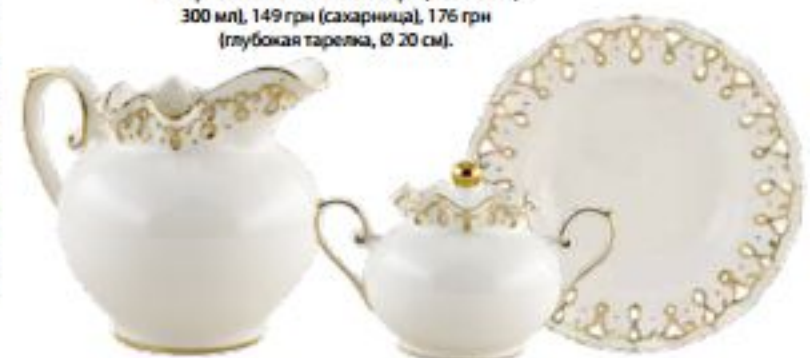
СЕРВИЗ. Интернет-магазин Lora. 118 грн (молочник, 300 мл), 149 грн (сахарница), 176 грн (глубокая тарелка, Ø 20 см).

кальная плитка, по диагонали. Получается приятный глазу геометрический ритм, по-новому играет даже простой узор плитки. Обеденную зону акцентирует изящная кованая люстра, столик и стулья также кованые, как будто садовая мебель. Однако это облегченный вариант ковки, поскольку предметы предназначены для квартиры.